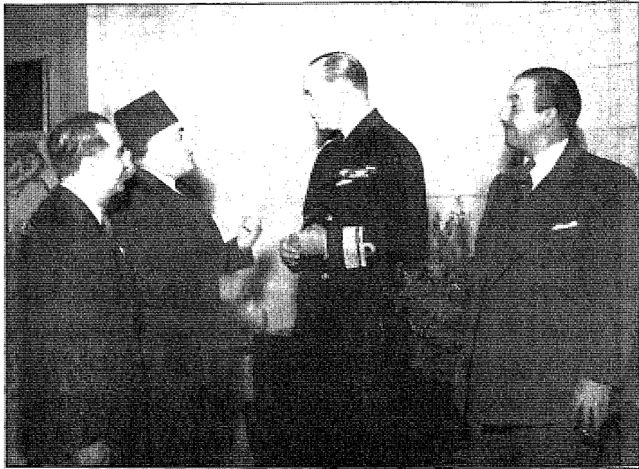
كريم ثابت مع الملك باول ملك اليبوتان